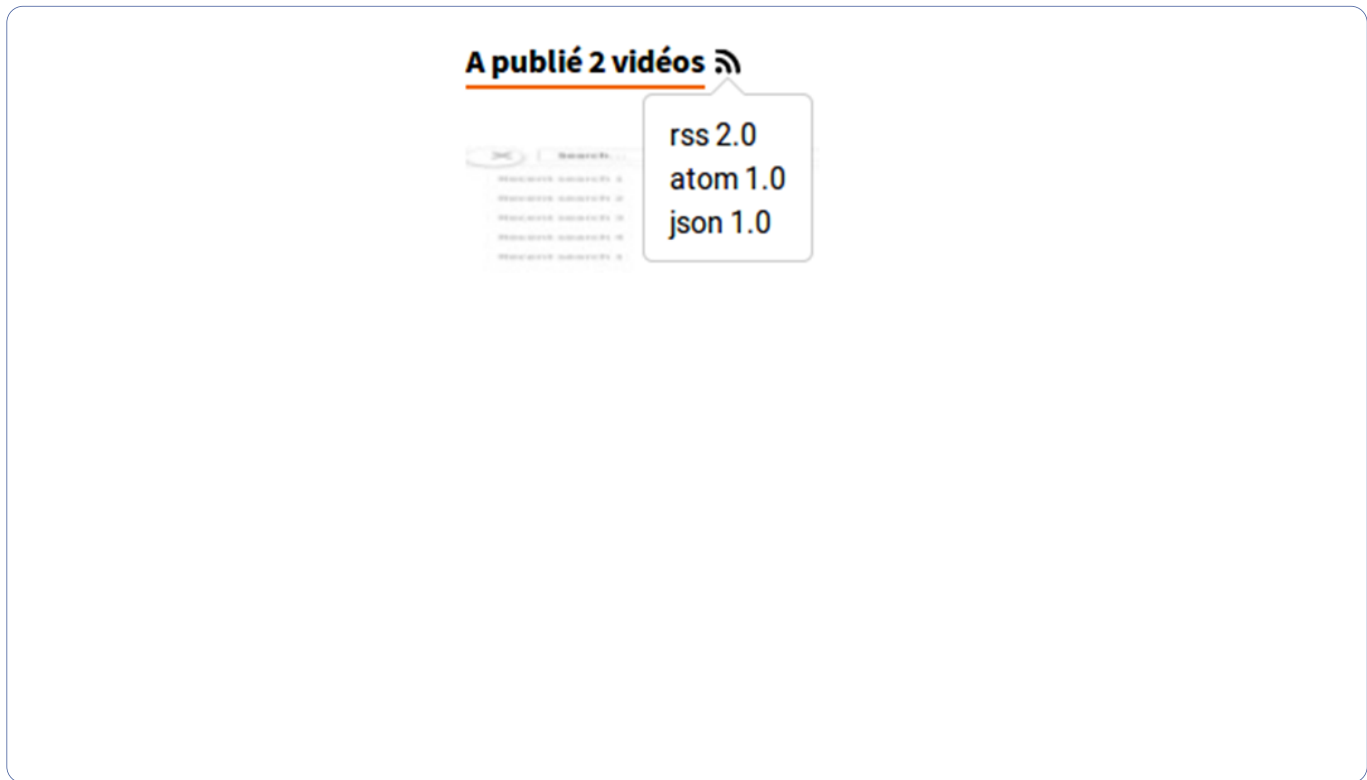
Illustration : suivi

Vos amis, collègues et votre public plus large peuvent voir et être informés des nouvelles vidéos que vous publiez sans avoir à vérifier régulièrement. Pour ce faire, ils peuvent "suivre" l'une de vos chaînes (ou l'ensemble de votre profil) via leur compte Peertube.!