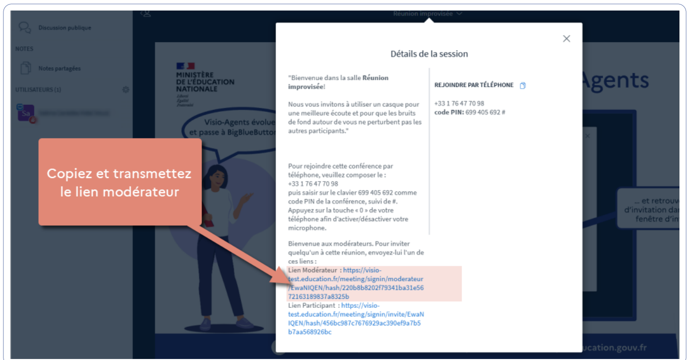
Illustration : copiez et transmettez le lien modérateur.

Copiez et transmettez le lien modérateur.